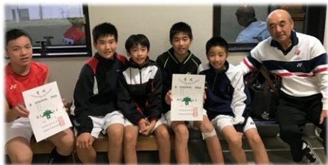
男子1年生 & 監督