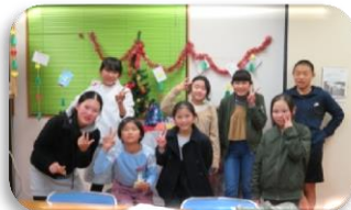
高学年教室 小学4年～6年

12月は大好きなクリスマス会。飾りつけやプレゼント交換で楽しい時間を過ごしました。子どもたちはイベントを通して英語を楽しく学んでいます♪