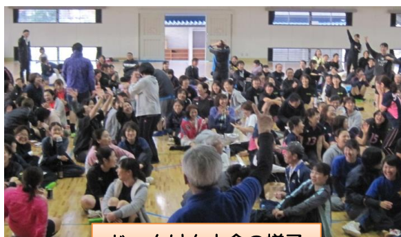
じゃんけん大会の様子