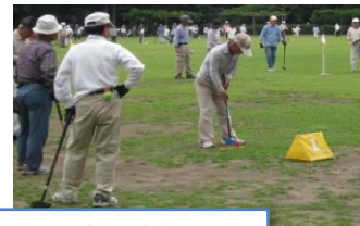
入賞の皆様 と大会の様子