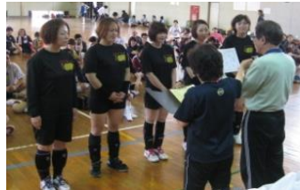
女子一般 優勝 LOTUS