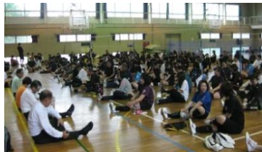
準備運動はしっかりと♪

怪我もなく、無事大会を開催することができました。31チーム、160名の方が参加し、最後のじゃんけん大会まで盛り上がりました。準備・片付けのご協力ありがとうございました。