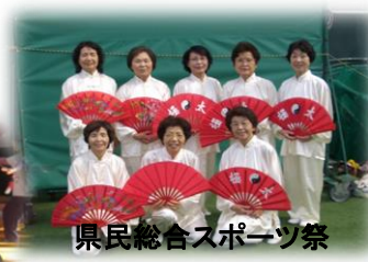
県民総合スポーツ祭