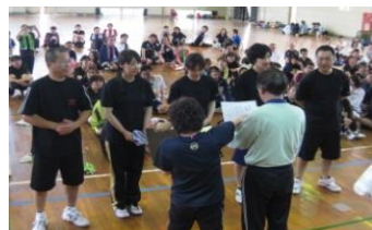
混成一般 優勝 ONE PIE'S(A)