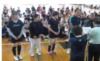
混成壮年 優勝 下北